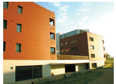
2 MFH Bösgass Buttisholz

Standort: Bösgass Buttisholz Bauherr: Korporation Buttisholz Verfahrensart: Studienauftrag Baujahr: 2005-2006