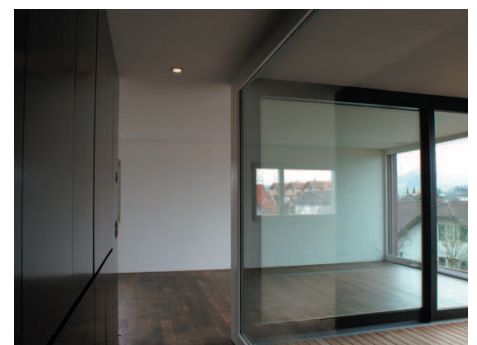
MFH Ausserdorf in Ettiswil

Standort: Ausserdorf Ettiswil Bauherr: STWE-Gemeinschaft Verfahrensart: Direktauftrag Baujahr: 2007-2008