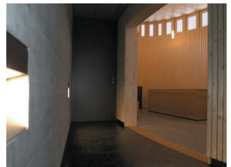
Aufbauungsraum in Escholzmatt

Standort: Friedhof Escholzmatt Bauherr: Einwohnergemeinde Escholzmatt Verfahrensart: Direktauftrag Baujahr: 2007