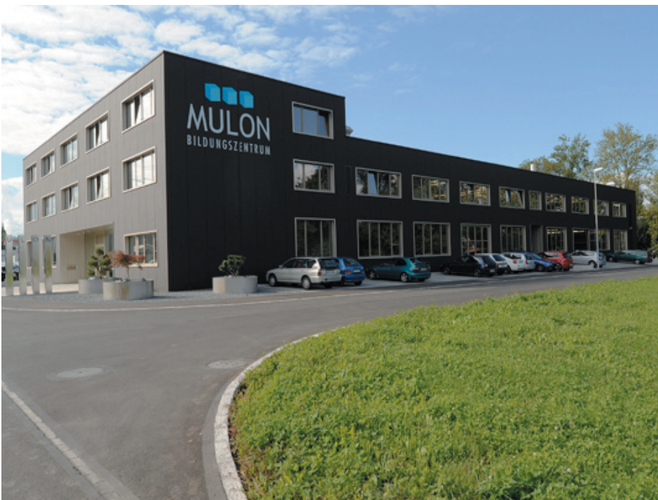
Schulungsgebäude MULON in Sursee

Standort: Sappeurstrasse 3, Sursee Bauherr: Metall-Union LU OW NW Verfahrensart: Direktauftrag Baujahr: 2009-2010